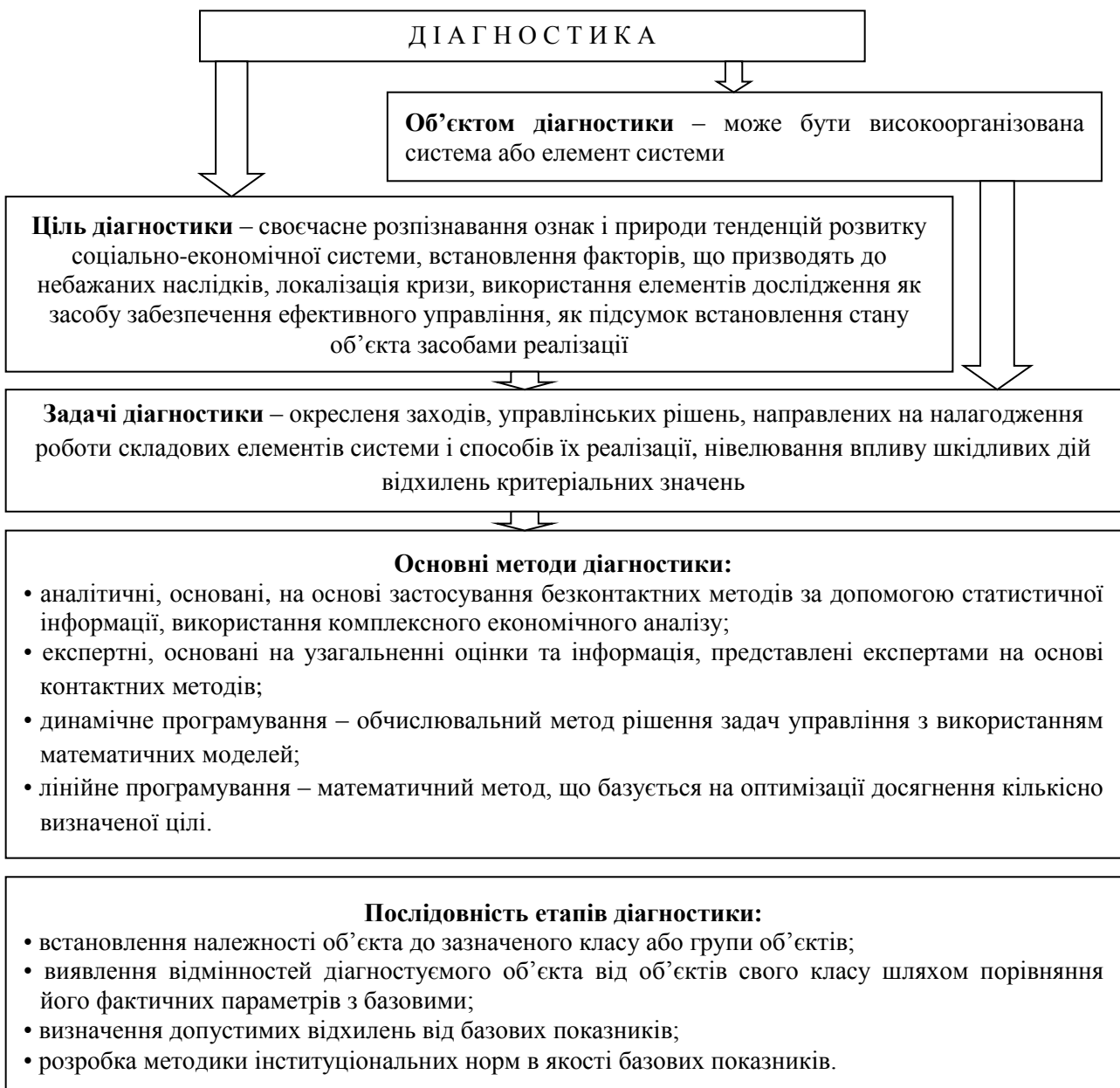
Рис. 2. Організація процесу діагностики*

Важливим аспектом у процесі проведення діагностики є правильна її організація, під якою розуміють визначення об'єкта діагностування, основних цілей та завдань, які необхідно розв'язати. Візуально це відображено на рис. 2.