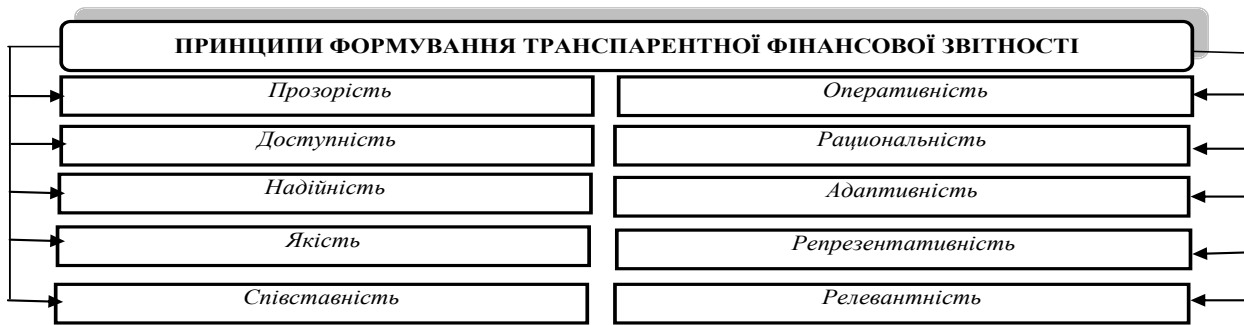
Рис. 2. Принципи формування транспарентної фінансової звітності за МСФЗ*