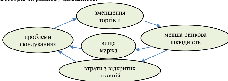
Рис. 2. Спіралі ліквідності [7, с. 25]

Крім того, спостерігається взаємний вплив ринкової ліквідності та ліквідності фондування. Так, зростання ліквідності фондування у фінансових установ (перш за все у банків) сприяє нарощенню позик цінними паперами та грошовими ресурсами, що підвищує можливості учасників ринку з укладання угод на ринку і призводить до зростання ринкової ліквідності. З іншої сторони ринкова ліквідність є передумовою ліквідності фондування – висока ліквідність зменшує маржинальні вимоги до фінансових установ, які торгують фінансовими інструментами, що сприяє накопиченню ліквідності фондування. У кризові періоди взаємний зворотний зв'язок може призвести до значного зменшення ліквідності через реалізацію спіралей ліквідності (рис. 2).