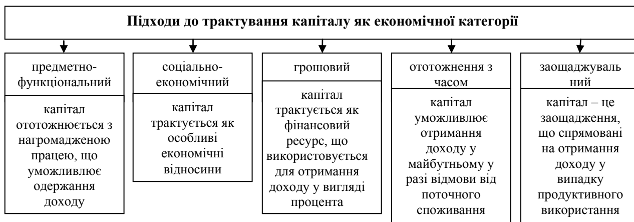
Рис. 1. Підходи до трактування капіталу*

У сучасних економічних джерелах обґрунтована позиція, що капітал як економічна категорія може розглядатися з різних позицій в залежності від об’єкта конкретного дослідження. Дані підходи подані на рис. 1.