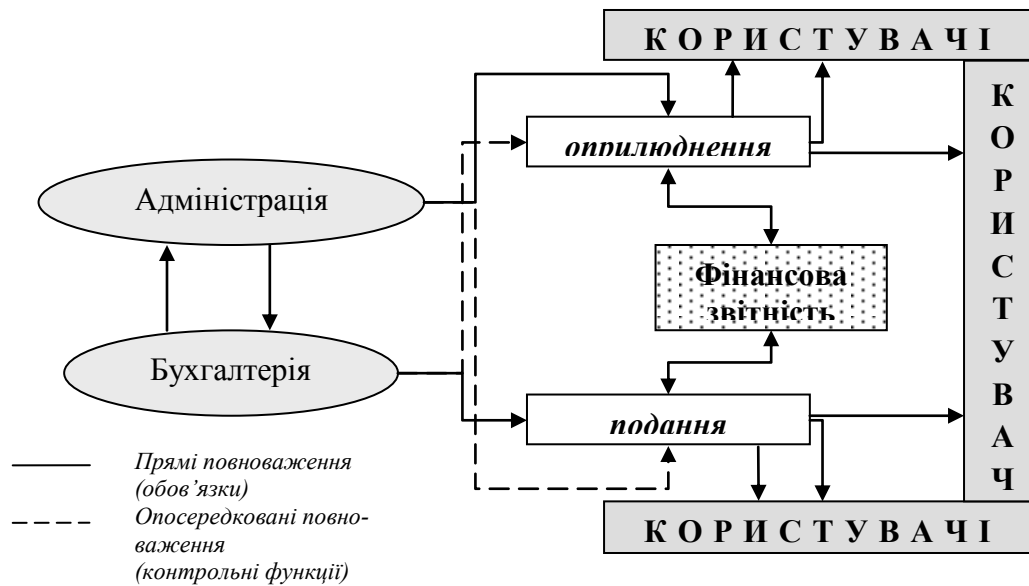
Рис. 1. Схема розподілу повноважень при розкритті інформації про підприємство з метою формування внутрішніх регламентів*

впливу організації бухгалтерського обліку на рішення користувачів.