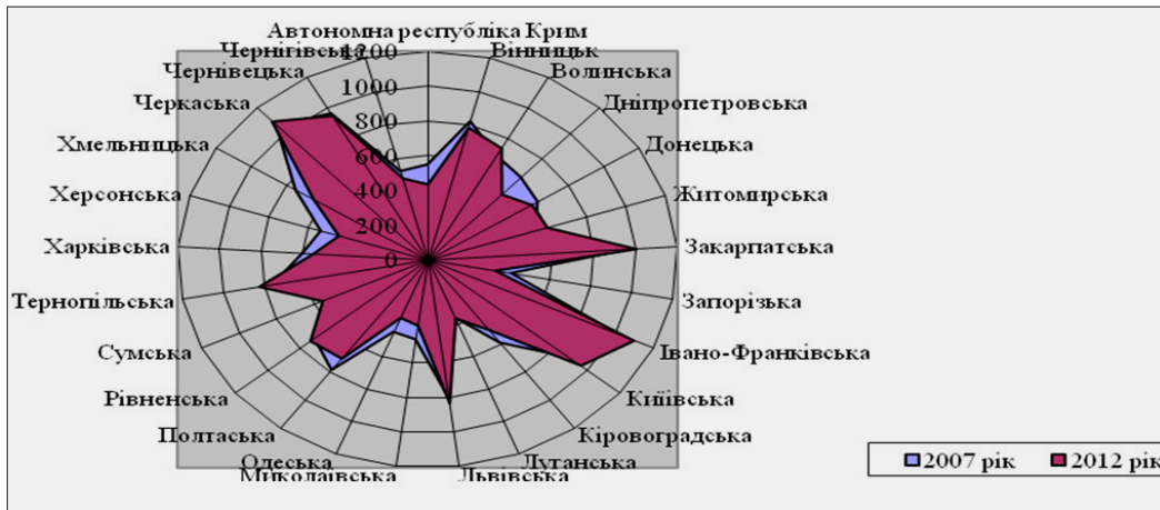
Рис. 1. Валова продукція сільського господарства у розрахунку на 100 га сільськогосподарських угідь за регіонами, тис. грн. [1]

Аналізуючи динаміку наявності основних видів сільськогосподарської техніки в Україні (табл. 1), можна стверджувати про значне її зменшення на аграрних підприємствах.