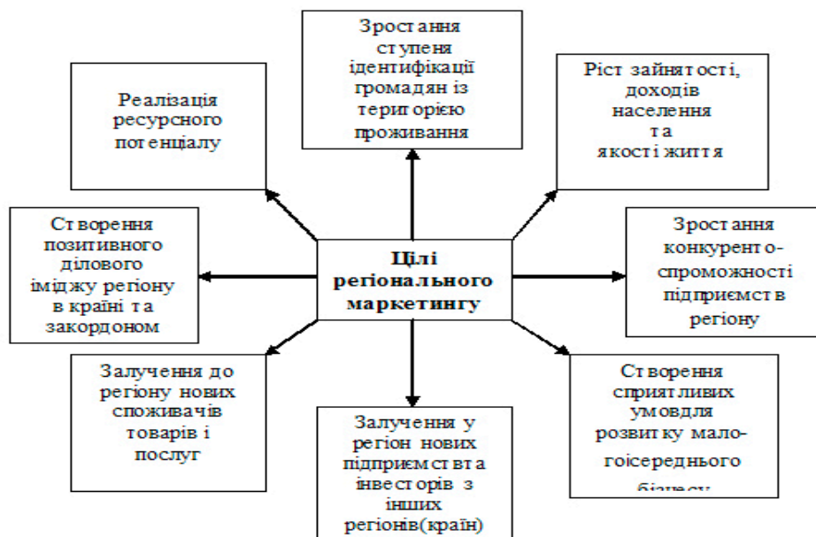
Рис. 2 Основні цілі регіонального маркетингу[10, с.53]

в регіон економічних агентів, здатних підвищити добробут жителів регіону. Точно так само, як маркетинг продукту виявляє і доводить до споживача унікальні властивості продукту, регіональний маркетинг виявляє і частково створює унікальні властивості регіону, які можуть бути корисні для споживачів: для підприємців – близькість ринків збуту, кваліфікація робочої сили; для туристів – кліматичні умови, пам'ятки; для інвесторів - ціни на нерухомість, злагоженість процедур купівлі-продажу власності. Основні цілі регіонального маркетингу відображені на рис 2.